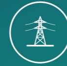
Energie- und Ressourceneffizienz