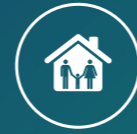
Komfort und Gesundheit