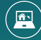
Digitalisierung und BIM