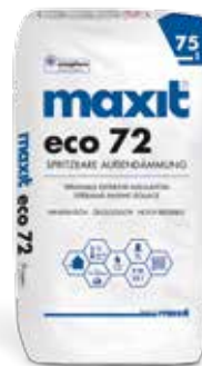
maxit eco 72 Spritzbare Außendämmung | 75 l