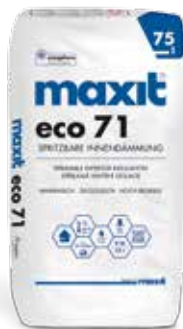
maxit eco 71 Spritzbare Innendämmung | 75 l